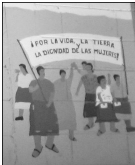
Detalle del mural de la organización Ixmucané.

También existen dos pueblos indígenas propios del Petén: los Itzá, ubicados sobre todo en el municipio de San José y que contaban en el 2002 con una población de 1.983, y los Mopán, ubicados en el municipio