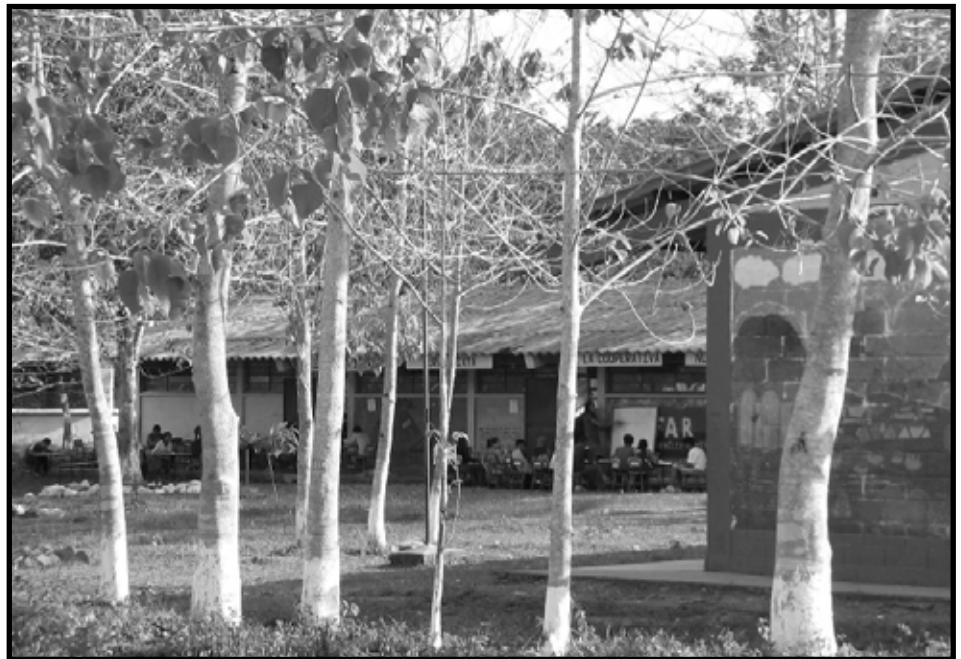
La escuela de la Cooperativa Nuevo Horizonte.

Antes de decidir que íbamos a operar como cooperativa fuimos a ver todas las cooperativas que existen en Guatemala, y ninguna nos satisfizo, y es allí donde diseñamos nuestra cooperativa como la queríamos. Dijimos que nosotros queremos una cooperativa modelo, donde primero enseñemos al gobierno que con voluntad política se pueden hacer las cosas, y nosotros vamos a hacer las cosas que