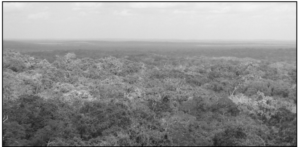
Panorámica de la Reserva de la Biosfera Maya.

En 1995 la RBM tenía que enfrentar serios problemas, sobre todo en cuanto a la deforestación y depredación del patrimonio cultural. Para contrarrestar esta tendencia, el CONAP otorgó concesiones a las comunidades ubicadas dentro de la RBM, muchas de ellas ya desde antes de la declaración de la RBM, con el objetivo de compartir la administración de estas áreas y así mantener los bosques intactos 7 , además de resolver la conflictividad que existía con