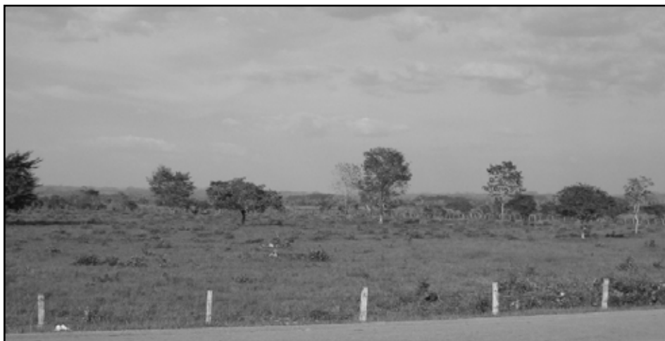
Grandes extensiones del Petén están siendo usadas para la ganadería extensiva.