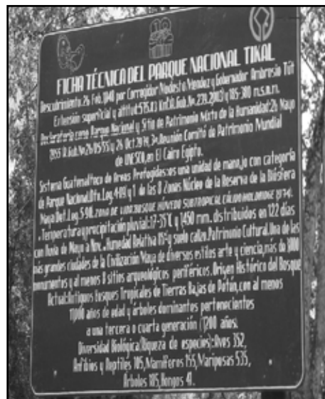
Ficha técnica del Parque Nacional Tikal.

24 CONAP, Plan Maestro de la Reserva de la Biosfera Maya 2001-2005, p.15.