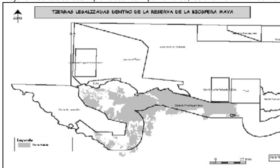
Tierras legalizadas dentro de la Reserva de la Biosfera Maya.

asentamientos humanos. A la mayoría de los retornados se les pudo reubicar en otras áreas y, por medio de FONTIERRAS, se logró la regularización de su tierra. Sin embargo, posteriormente se han ido dando otras invasiones, con diferentes causas, entre otras, campesinos que han sido desalojados de departamentos cercanos como Alta Verapaz e Izabal se han ido para El Petén buscando nuevas tierras, ya que se cree que hay tierras para ocupar en el departamento. Sin embargo, todas las tierras estatales ya han sido entregadas y los únicos espacios "libres" que quedan son las AP, por lo cual, los campesinos invaden estas áreas y luego son desalojados por las autoridades. Por otra parte se descubrió, a mediados del 2006, la inscripción irregular en el Registro General de la Propiedad de 10 fincas dentro de parques nacionales, cinco en el Parque Nacional Laguna del Tigre (PNLT) y cinco en el Parque Nacional Sierra del Lacandón (PNSL), a pesar de que no se permiten asentamientos humanos, ni la producción agrícola o ganadera en estas áreas. Las extensiones sumaban mil 219 caballerías (equivalente de 16,371 hectáreas) y según las autoridades, esas fincas podrían ser usadas para actividades del narcotráfico 12 . Además, se han detectado varias pistas de aterrizaje clandestinas durante sobrevuelos hechos por el área; sólo en el PNLT se han