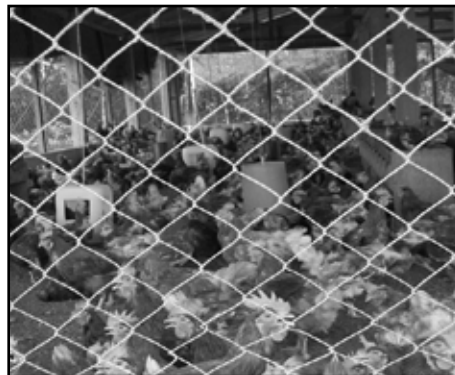
Proyecto productivo de gallinas en la cooperativa.

pues lo vamos a hacer a través de la vía legal. Porque si de algo estamos convencidos es que la guerra terminó, pero la lucha no terminó. Y hoy más que nunca la herramienta que Nuevo Horizonte y las organizaciones tenemos que agarrar son los Acuerdos de Paz. Es la única herramienta legal que nos queda para poder empezar a partir de allí con las organizaciones, con las comunidades, que el gobierno empiece a cumplir los Acuerdos. Porque los Acuerdos sustantivos no los han cumplido. La reducción del ejército, ellos lo hicieron a su sabor y antojo. Cuando se llegó a la época de la desmovilización del ejército, los que destituyeron del ejército empezaron a formar parte de la Policía Nacional Civil, los mismos corruptos que están allí. Y no se formó esa Policía Nacional Civil con otra idea, con otra visión, con otra forma de ver la situación.